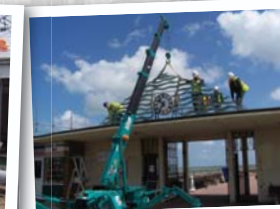
Travaux de large voiries