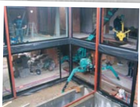
Pose de vitrages